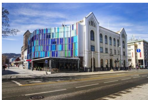
Alma's Restaurant ved Byscenen.